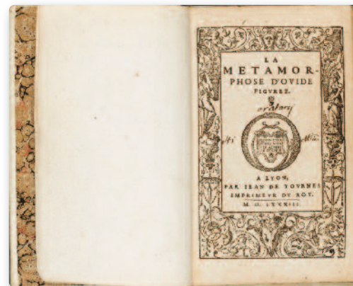
Bernard Salomon La métamorphose d'Ovide figurée, Lyon, Jean de Tournes, 1583, don 1996