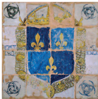
Masséot Abaquesne Élément de pavement à l'emblématique d'Henri II, Rouen, vers 1550, don 1975