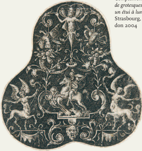
Etienne Delaune Composition de grotesques pour un étui à lunettes, Strasbourg, 1573, don 2004