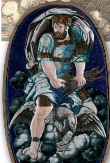
Jacopo Caraglio d'après Rosso Fiorentino, Jupiter Rome, 1526, don 2007