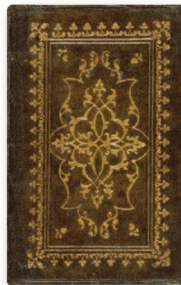
Etienne Roffet Reliure des Commentaires de Jules César édité par Sébastien Gryphe, Lyon, 1538, don 1997

Société des Amis du musée national de la Renaissance (association sous le régime du 1 er juillet 1901) Château d'Écouen 95440 Écouen téléphone / fax : 01 39 90 11 51 courriel : amis.renaissance.ecouen@club-internet.fr