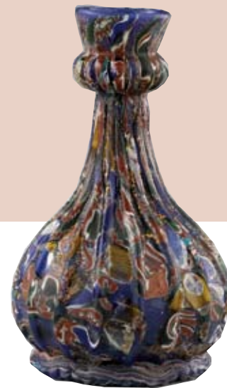
Petit flacon de verre à cosmétiques Venise, fin XVI e s. - début XVII e s. Verre soufflé bleu émaillé Écouen, Musée national de la Renaissance

La réalité matérielle des soins de beauté est décrite à travers l'une de ces Vénitiennes si réputées pour l'attention qu'elles apportaient à leur toilette. Installée près de ses pots à cosmétiques, revêtue d'un peignoir de soie ( schiavonetto ), cette femme est protégée par le fameux solana , chapeau sans fond pour décolorer ses cheveux au soleil sans nuire à la blancheur de son teint.