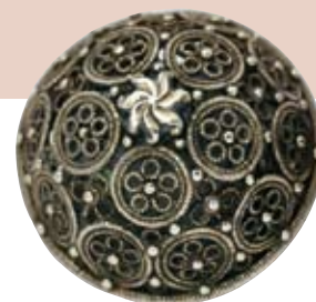
Pomme d'ambre provenant d'un rosaire Italie, XVI e s. Argent niellé et doré ; Grasse, Collection de la Parfumerie Fragonard

Objet phare d'un trésor découvert fortuitement en 1912 à Londres à l'emplacement d'une maison d'orfèvre du début du XVII e siècle, ce flacon à parfum orné de pierreries se portait à la ceinture ou en pendentif, comme un bijou précieux