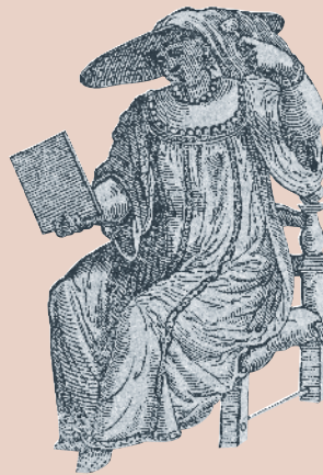
Cesario Vecellio Vénitienne blondissant ses cheveux Venise, 1590 Gravure sur bois Écouen, Musée national de la Renaissance

Réalisée en réduction d'après une statue de Jean de Bologne commandée en 1583 par François de Médicis, cette Vénus aux formes fluides représentée en baigneuse est à l'origine de multiples copies jusqu'au XVII e siècle, preuves de son succès auprès des collectionneurs.