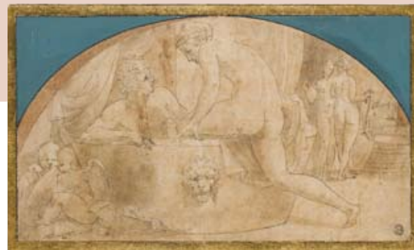
D'après Primaticcio Mars et Vénus au bain Avant 1543. Dessin Paris, Musée du Louvre, département des Arts graphiques

Déconcertant à première vue, hommage appuyé à la beauté de ces deux femmes en tenue de bain, qu'une autre version (musée du Louvre) représente nues, ce double portrait illustre les bains de plaisir et de convivialité qui sont l'un des temps forts de la vie aristocratique à la Renaissance.