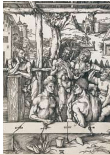
Albrecht Dürer Le Bain des Hommes Vers 1496. Gravure sur bois Reims, Musée Le Vergeur

A la Renaissance, la thématique des bains collectifs bénéficie d'une riche iconographie qui nous permet aujourd'hui d'en comprendre les gestes, usages et significations. A l'opposé de ces bains populaires, les rites du bain et de la toilette aristocratiques donnent naissance à un nouveau type de représentation qui détaille avec érudition cette forme inédite de sociabilité des élites européennes baignées de culture antique.