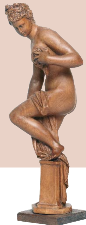
D'après Jean de Bologne Vénus debout s'essuyant, dite « Vénus Cesarini » Début du XVII e s. Poirier Écouen, Musée national de la Renaissance

Ici, l'une des fresques de l'appartement des bains royaux à Fontainebleau, que Primaticcio décora vers 1539-1543. Lieu de délasserment des sens, mais aussi de plaisir esthétique par les décors peints à fresque et les œuvres d'art présentées, l'appartement des bains royaux donnait à voir des scènes, parfois érotiques, inspirées de la mythologie antique et des habitudes de vie des Romains.