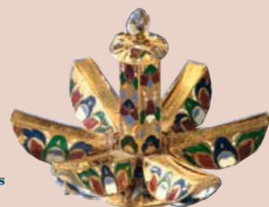
Pomme de senteurs s'ouvrant à six quartiers Pays-Bas, vers 1610-1620 Or émaillé ; rubis, émeraudes et diamants Inscriptions : gravées sur les glissières, en néerlandais, « Roosen B », « Caneel B », « Nagel B », « Angelica B », « Folie B », « Slack B » Amsterdam, Rijksmuseum

L'homme représenté fut bourgmestre d'une ville de Frise occidentale. Cette charge civique qui le rendait garant de la santé de ses concitoyens explique sans doute la présence de la pomme de senteurs qu'il tient à la main, comme un symbole d'hygiène publique.