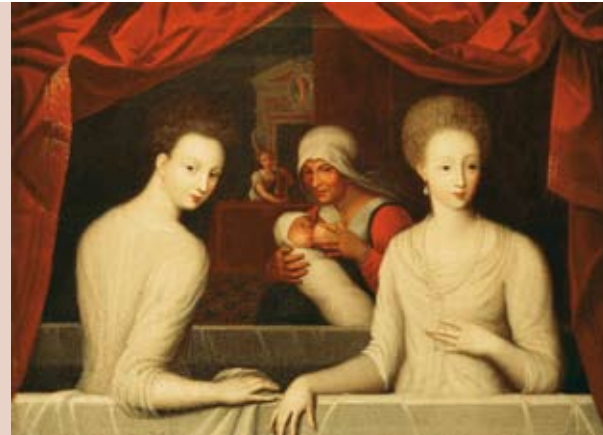
Gabrielle d'Estrées et sa sœur la duchesse de Villars au bain France, fin du XVI e s. Huile sur toile Montpellier, Musée languedocien

Bien loin de notre actuelle définition, la toilette de la Renaissance est un cérémonial public, de beauté et non d'hygiène, réservé à l'élite. Elle désigne ce moment particulier où l'on achève de se préparer, éventuellement en public, face à une table sur laquelle sont présentés les instruments de la beauté : miroirs et nécessaires, peignes et brosses, aiguïères et bassins à ablutions, parfums et bijoux. Comme pour le thème du bain, l'intérêt pour ce rite de beauté réinventé a donné naissance à un nouveau genre iconographique, le « portrait nu ».