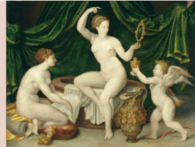
Vénus à sa toilette France, vers 1550 Huile sur bois Paris, Musée du Louvre, département des Peintures

Largement diffusé en France au XVI e siècle, ce petit livre propose très habilement une compilation du savoir domestique : préparations cosmétiques, remèdes empiriques et recettes culinaires. Il était destiné à un lectorat féminin issu des classes marchandes citadines.