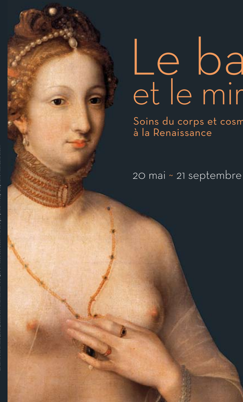
La dame à sa toilette (détail), Ecole de Fontainebleau vers 1560 e Musée des Beaux-Arts de Dijon-photo : F. Jay, Graphisme : fourzmandi.com