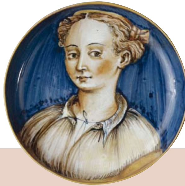
Coupe : portrait de femme ou « Bella » Casteldurante, vers 1540-1550 Faïence Paris, Musée du Petit-Palais

Albrecht Dürer inaugure, avec cette image qui faisait pendant à un Bain des femmes resté à l'état de dessin, l'une des premières représentations gravées sur le thème du bain populaire, reflétant son intérêt croissant pour la représentation du corps humain dans toute sa diversité.