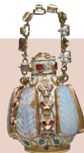
Flacon de senteurs garni de pierres précieuses et d'émaux France ou Angleterre, fin du XVI e -début du XVII e s. Or émaillé ; opales, opalines, diamants, rubis, saphir Londres, Museum of London

Objet phare d'un trésor découvert fortuitement en 1912 à Londres à l'emplacement d'une maison d'orfèvre du début du XVII e siècle, ce flacon à parfum orné de pierreries se portait à la ceinture ou en pendentif, comme un bijou précieux