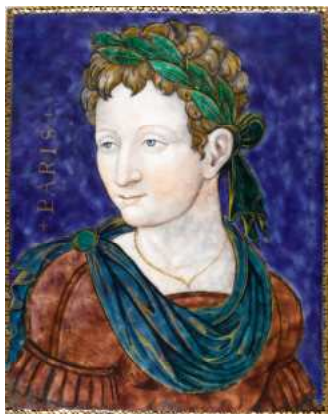
Léonard Limosin, Pâris

direction Persan-Beaumont / Luzarches Arrêt gare d'Écouen-Ezanville (25 min.) Puis Autobus 269, direction Garges-Sarcelles Arrêt Église/Mairie (5 min). Ou rejoindre le musée à pied depuis la gare (20 min) par la forêt