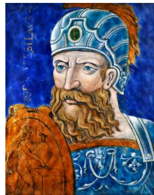
Léonard Limosin, Protésilas

Email peint, Limoges, vers 1564 Écouen, musée national de la Renaissance